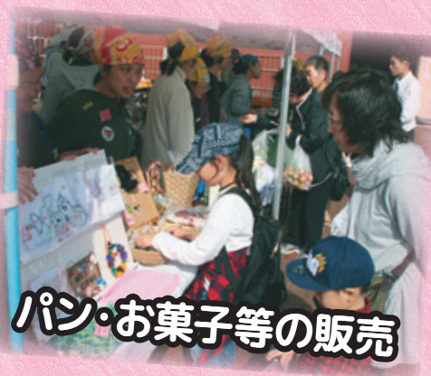
パン・お菓子等の販売