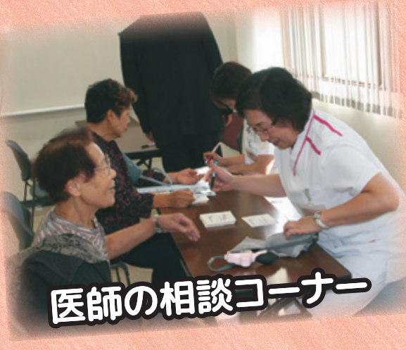
医師の相談コーナー