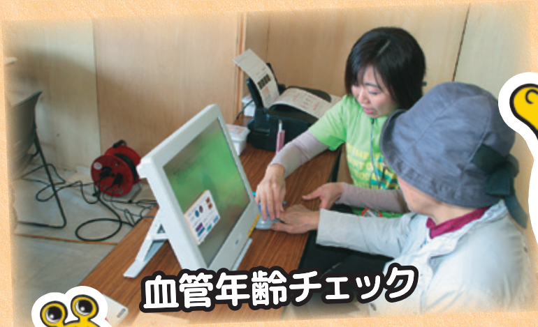
血管年齢チェック