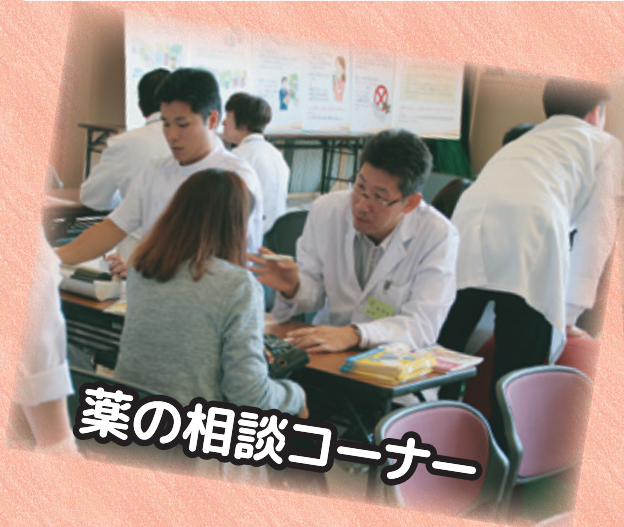
薬の相談コーナー