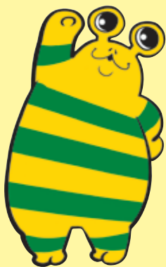
健康づくり普及員 イフくん