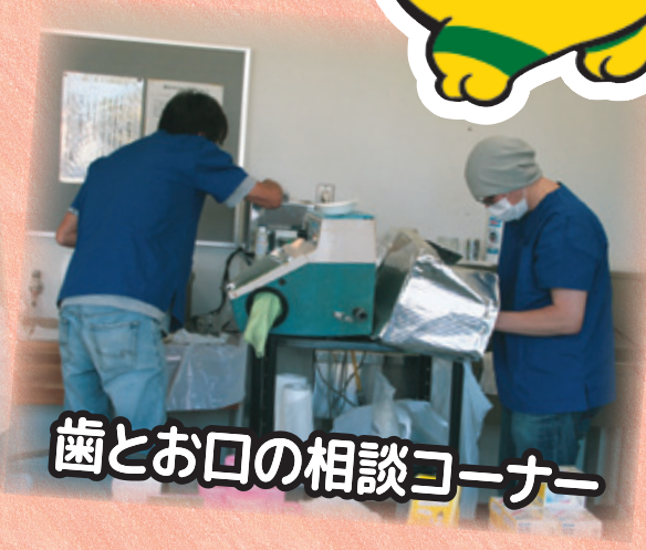
歯とお口の相談コーナー