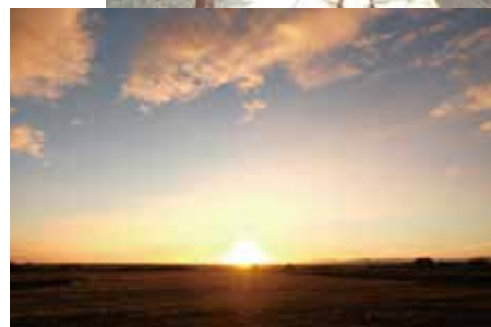
※写真は全てイメージです