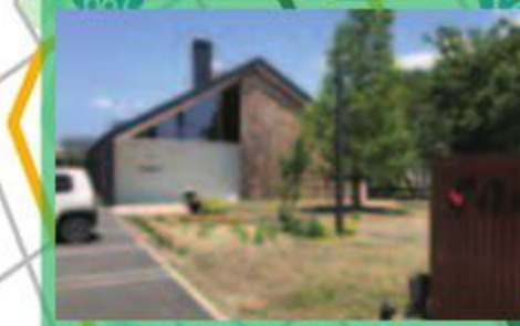
ほんだ岩見沢いなほ公園店

砂川に本店を構える人気のお菓子屋さん。カフェも併設しており、自慢のアップルパイをはじめ、りんごを使用したケーキなどをたくさん揃えています。