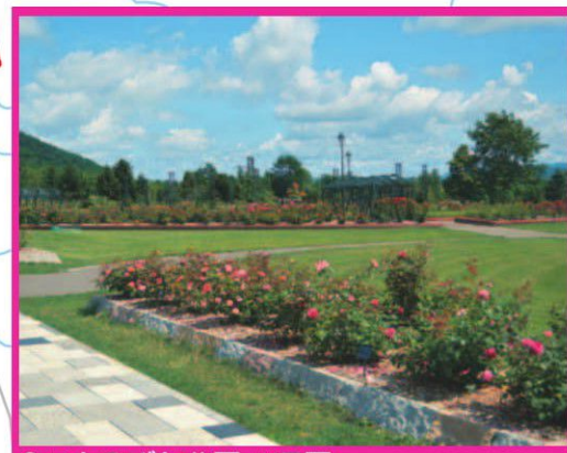
9.いわみざわ公園 バラ園