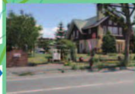
赤いリボンメープル倶楽部

岩見沢の人気洋菓子店「赤いリボン」のプロデュース店舗。カフェスペースも併設しており、美味しいケーキと共にどうぞ。